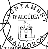
Nicolau Conti Fuster