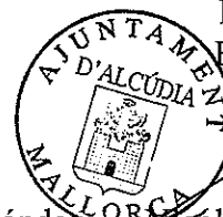
Nicolau Conti Fuster