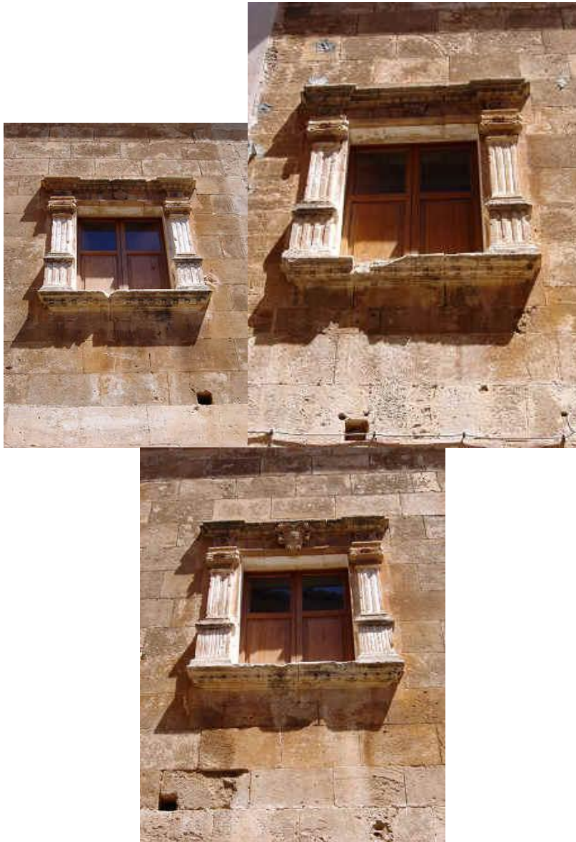
Finestres renaixentistes de la façana