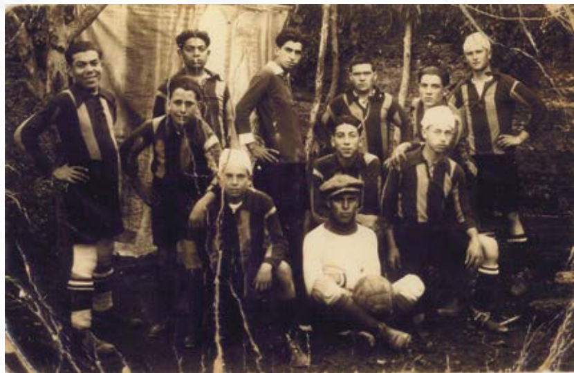
Victoria Eugènia F.C.

La lliga va durar entre novembre de 1924 i abril de 1925. Els Resultats varen ser els següents: