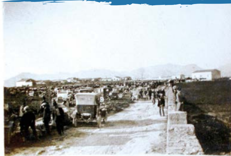
1924 partit de la esquadra anglesa

L'increment de l'afició al futbol a Alcúdia va fer necessari l'habilitació d'un terreny per a