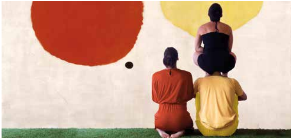
Joan Miró, Peinture (La magie des couleurs), 1930

MIRA MIRÓ de Baal Dansa i Teatre Principal Dansa Matinal per a escolars