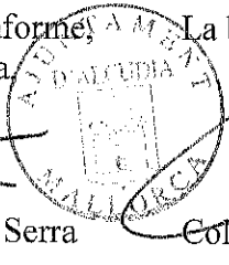
Coloma Terrasa Ventayol