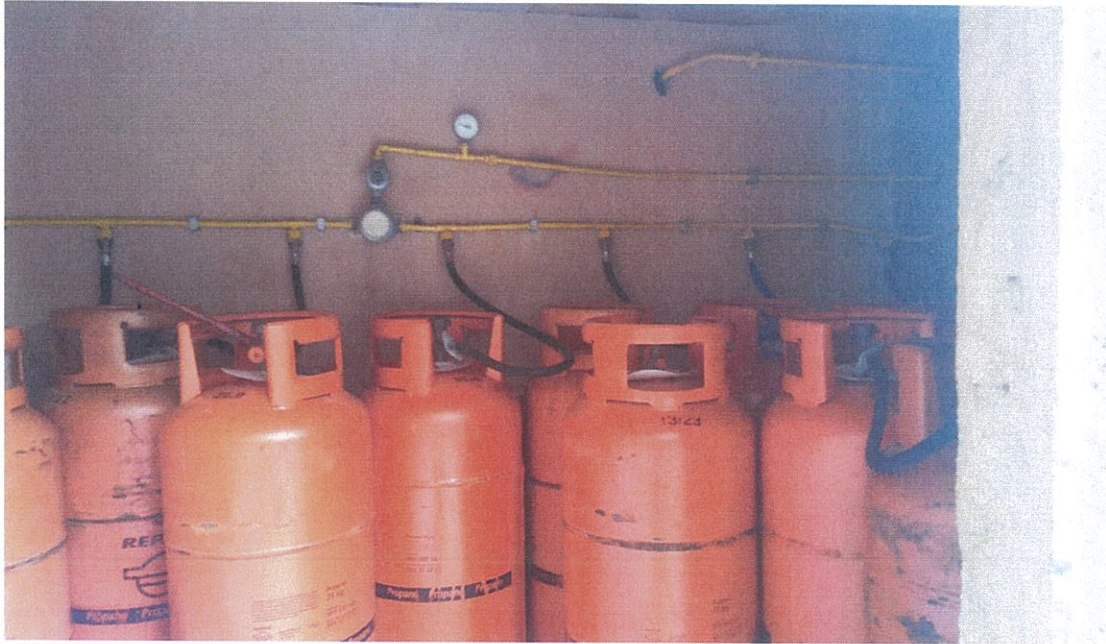
Batería depósitos GLP.

La instalación que discurre por el inferior de los equipos de gas se encuentra con deficiencias de anclaje y conservación.