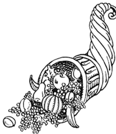
Corn de l'abundància