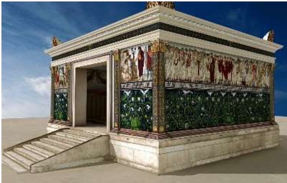
Ara Pacis (Roma)